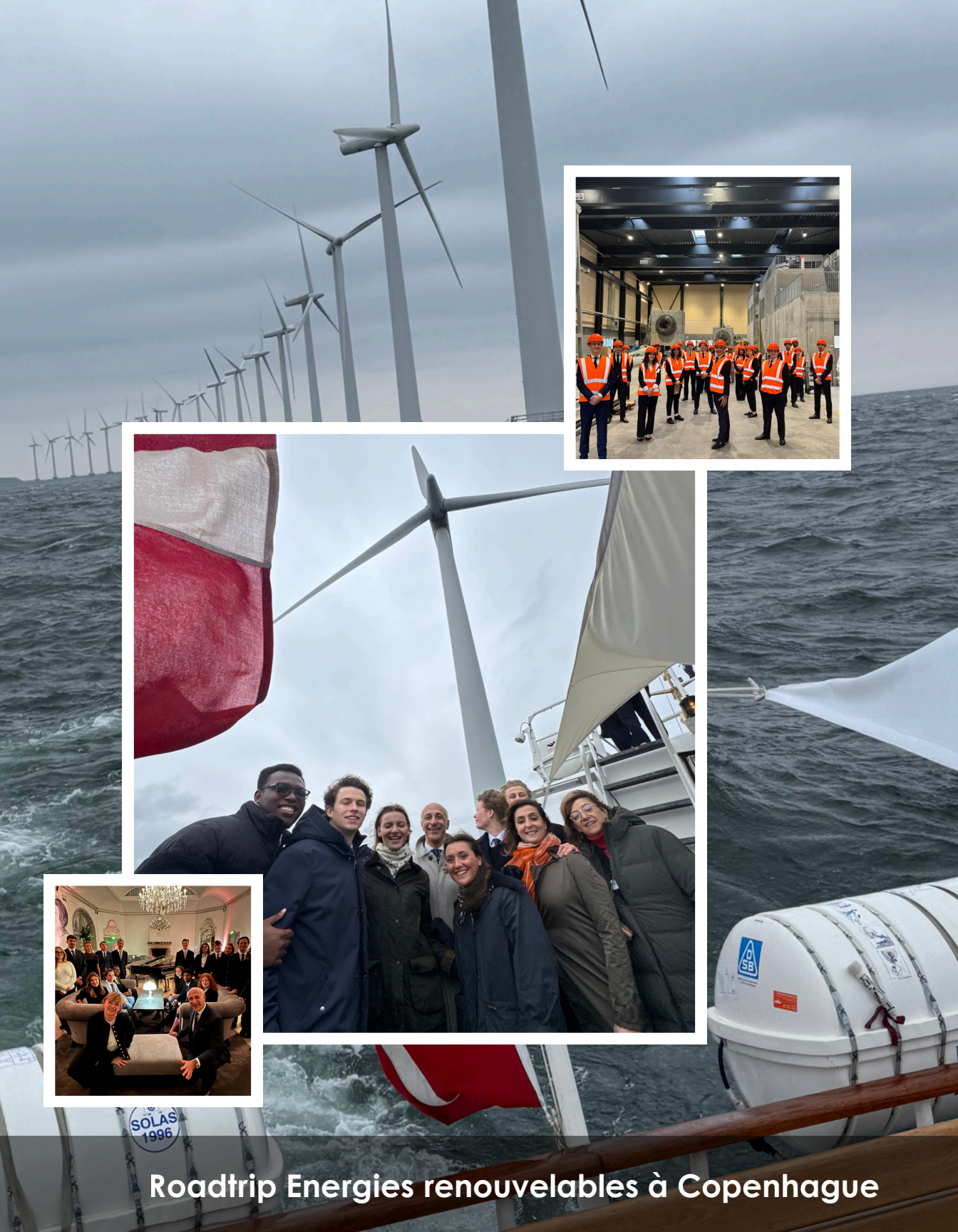
Roadtrip Energies renouvelables à Copenhague